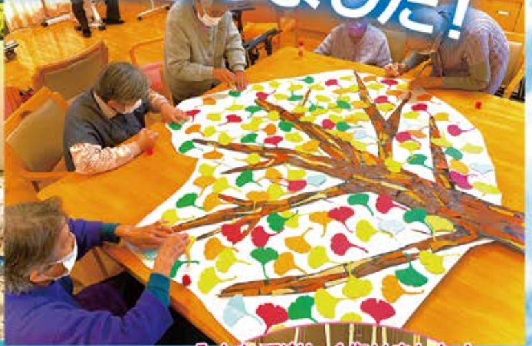
みんなで楽しく作りました!